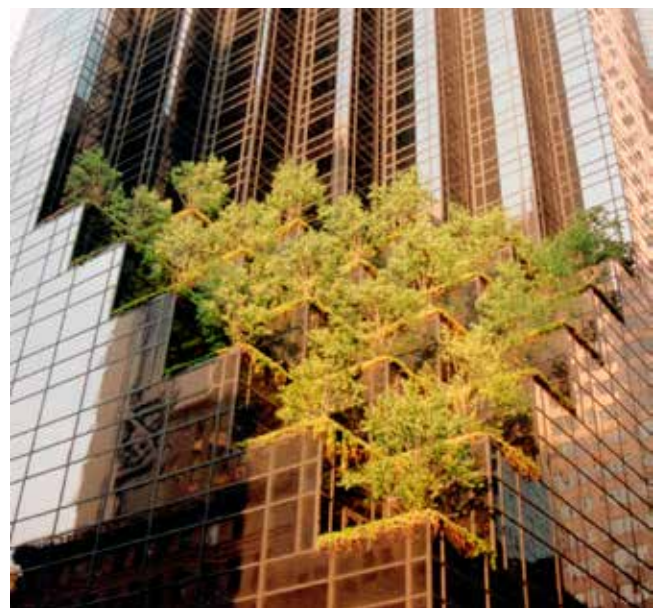
Los bosques urbanos y árboles regulan la temperatura y el agua para ciudades resilientes

La cobertura vegetal parece influir fuertemente en las temperaturas superficiales en Manchester, Reino Unido. La temperatura máxima de la superficie en los bosques urbanos es de 18,4 °C, mientras que en los centros urbanos con la menor cobertura arbórea es de 31,2 °C. Una adición de un 10 % de cobertura vegetal en los centros urbanos podría reducir las temperaturas superficiales máximas en 2,2 °C. Las proyecciones indican para la década de 2080 un aumento en las temperaturas superficiales máximas de 1,5 – 3,2 °C en los bosques, y de 2 – 4,3 °C en el centro de las ciudades, dependiendo del escenario de las emisiones. 105