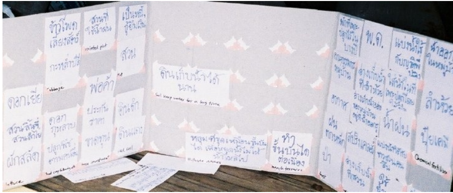
Figure 2. Les cartes sont placées sur un panneau pour qu'elles puissent être vues d'un coup d'œil.